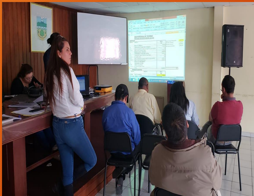
AROBACION PLAN ANUAL DE CONTRATACION