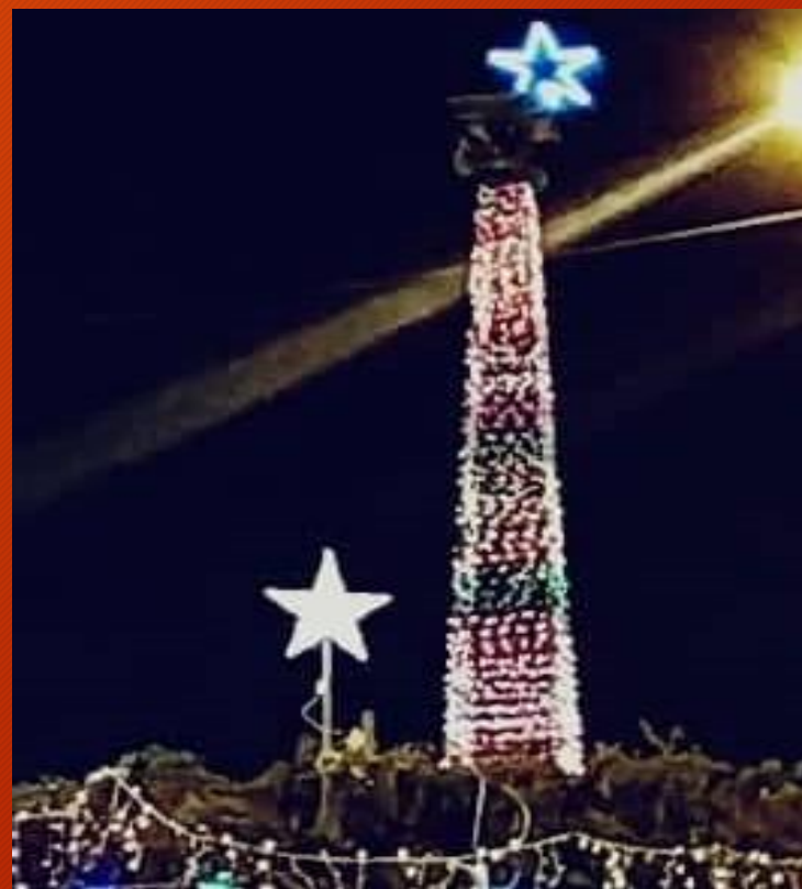
PROYECTO ALEGORIAS NAVIDEÑAS