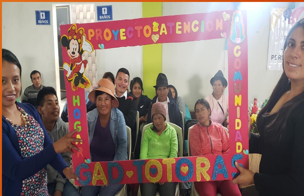
AJASAJO NAVIDEÑO GRUPOS VULNERABLES GAD