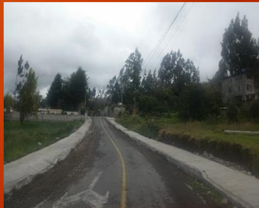
INSPECCION OBRA ACERAS Y BORDILLOS EN VARIAS ZONAS DE LA PARROQUIA