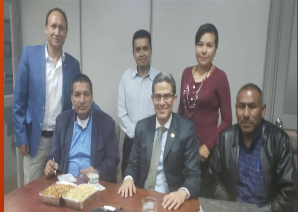
GESTION DE OBRAS GAD MUNICIPAL