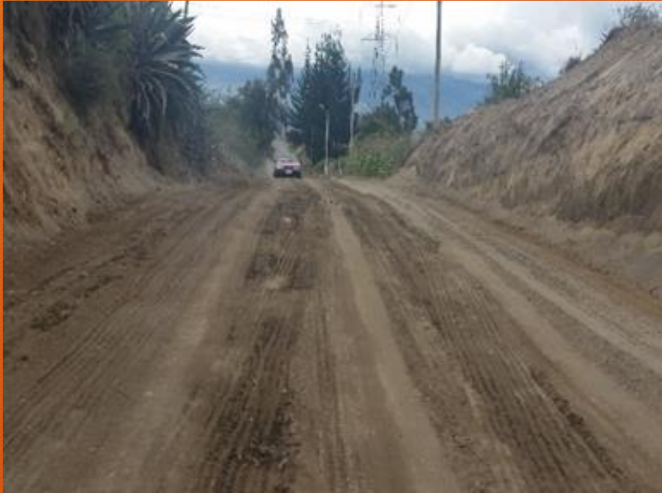
ARREGLO DE VARIAS VIAS DE LA PARROQUIA