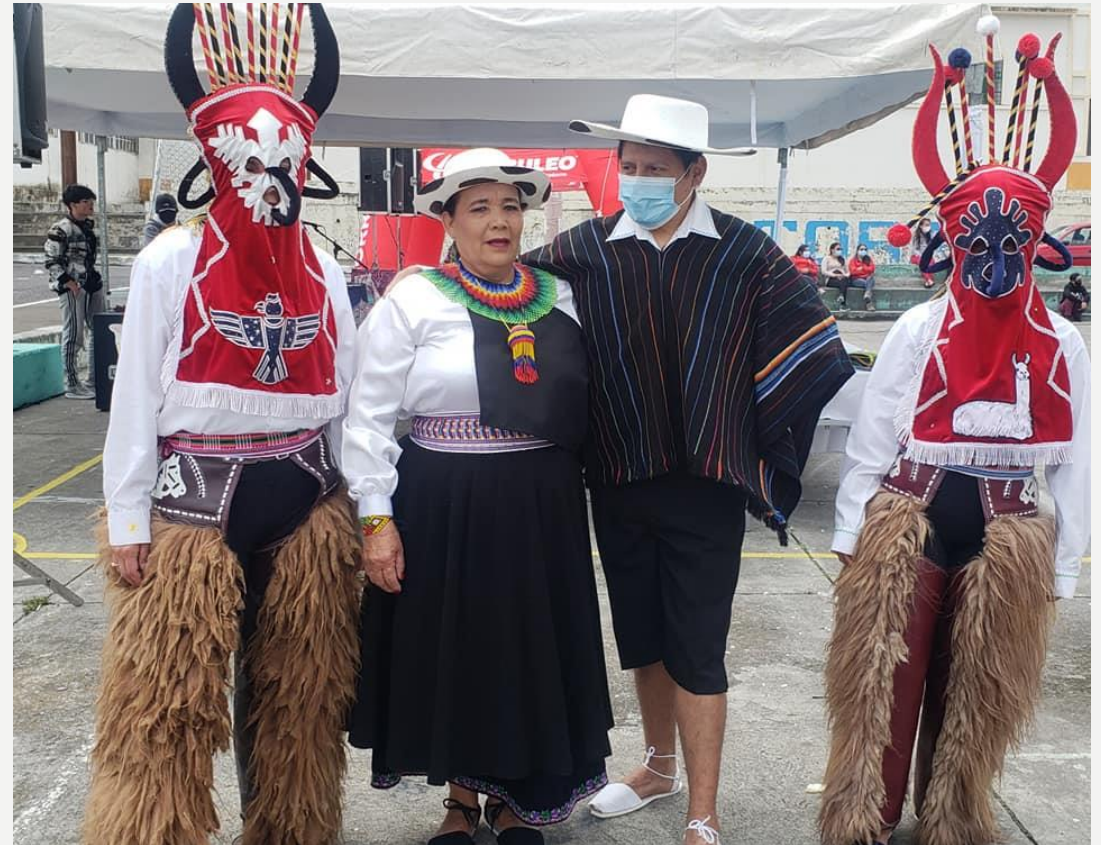
DÍA DEL ADULTO MAYOR