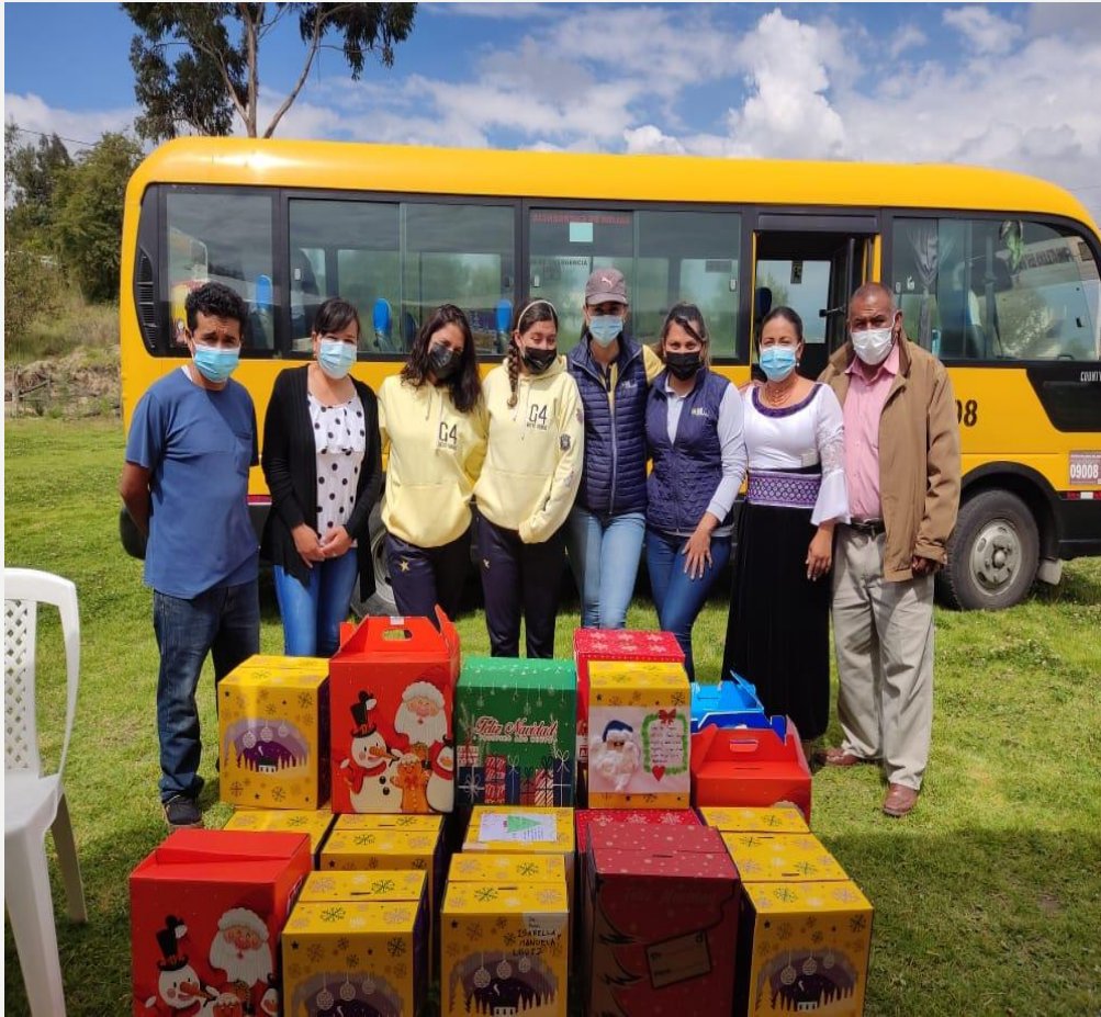
AGASAJOS NAVIDEÑOS GRUPOS VULNERABLES DEL GAD