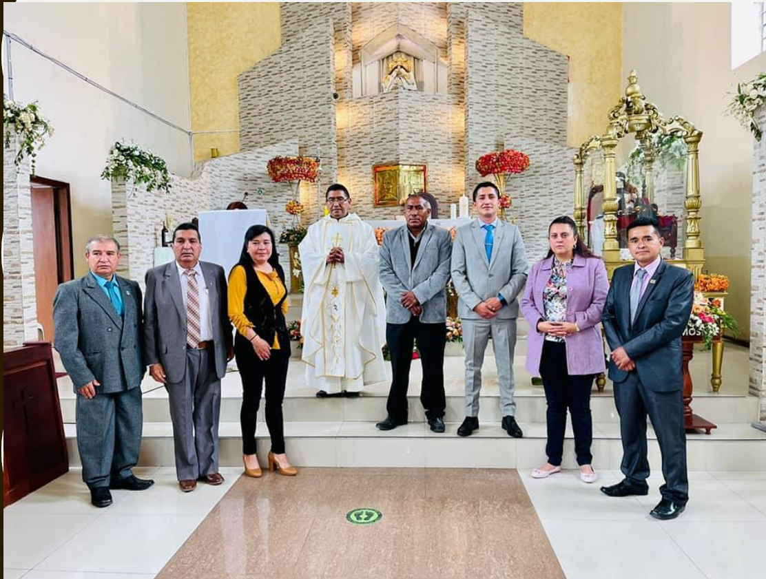
SESIÓN SOLEMNE GADR TOTORAS