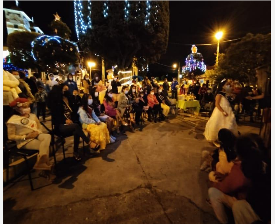
ENCENDIDO DE LUCES DE NAVIDAD